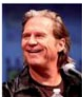
Jeff Bridges http://it.wikipedia.org/wiki/Jeff_Bridges